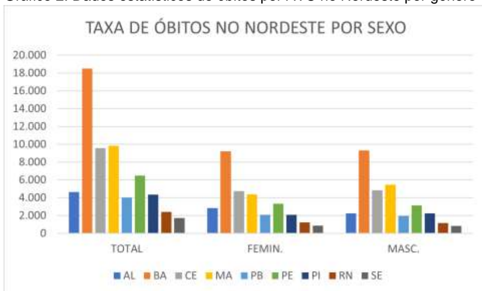
Gráfico 2. Dados estatísticos de óbitos por AVC no Nordeste por gênero